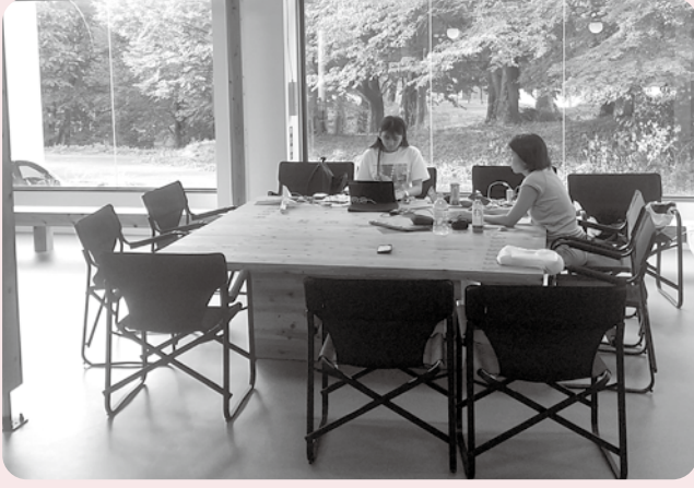
大人はクラブハウス美山でテレワーク

当市とワークショップパートナーシップ協定を締結している富士通グループの親子ワークショップモニターツアーが行われました。親子でのツアーは初開催となり、大人はクラブハウス美山等のワークスペースでテレワークをしつつ、こどもたちは美山公園などで糸魚川での自然体験を楽しみました。