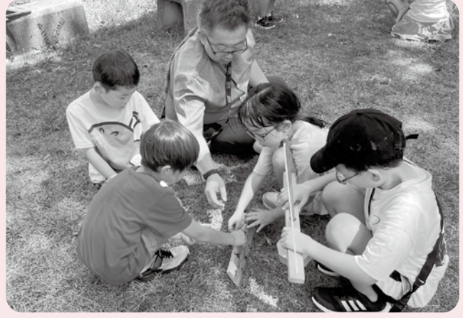
こどもたちは火起こし体験を楽しみました