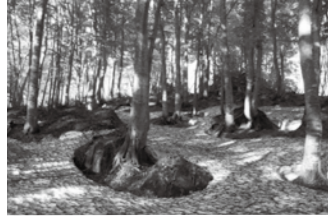
雪解け水をたたえるブナ林